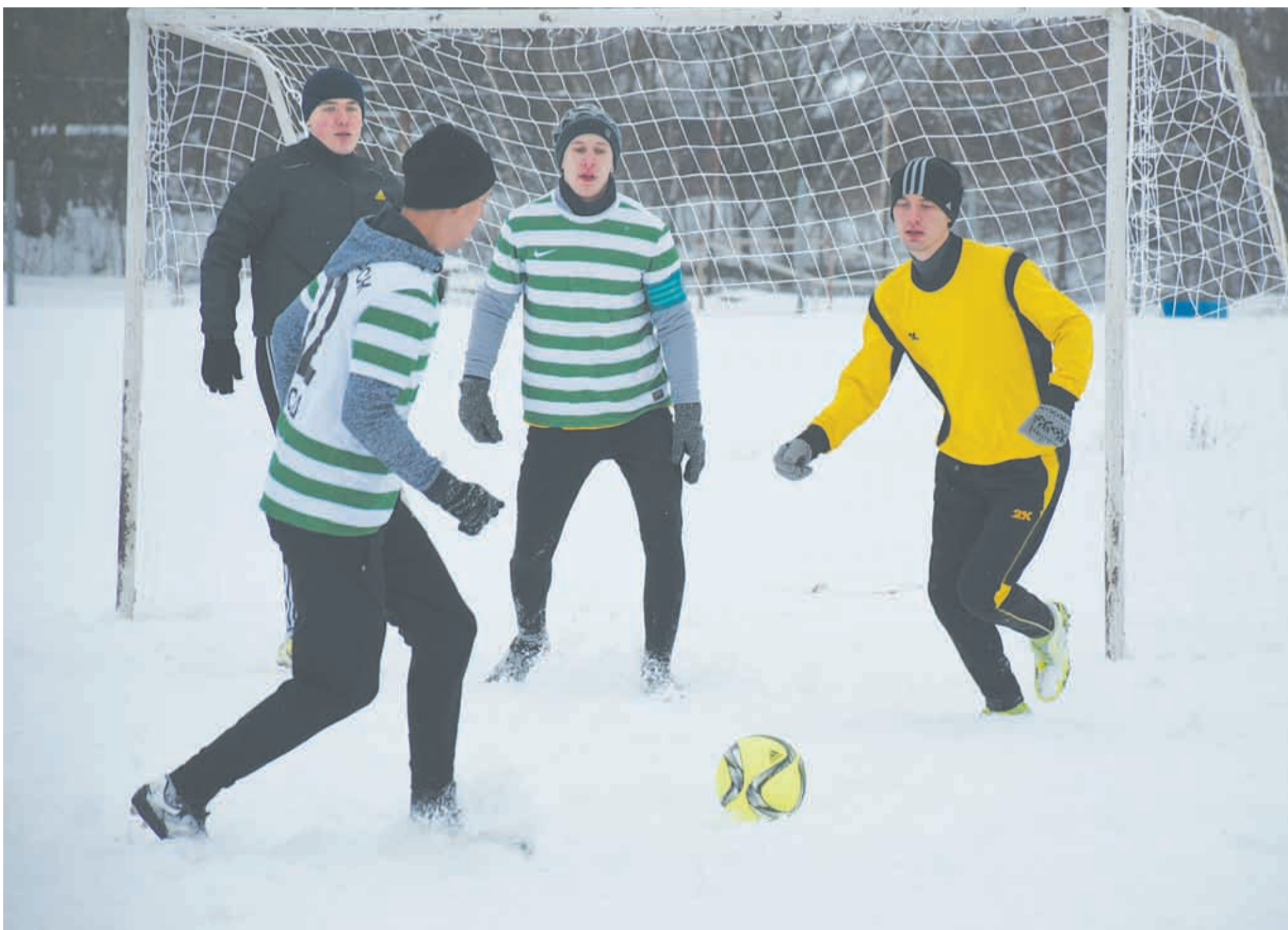
В первом туре команда «ЭКОлаб» сыграла с «Энергией».

Спорт / Прошло открытие первенства по зимнему футболу на кубок главы города